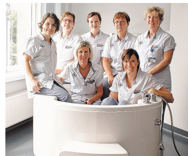
We zien enkele vroedvrouwen in het relaxatiebad in het verloskwartier. Het relaxatiebad kan in bepaalde gevallen als bevallingsbad worden gebruikt. “Alleen als er geen complicaties zijn en als er sprake is van een geheel normale zwangerschap en arbeid, is een onderwaterbevalling mogelijk.”