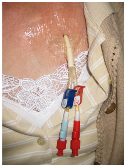
Photo d'un pansement de cathéter

En cas d'infection, on applique au cathéter un pansement spécial qui a une action désinfectante sur le site d'insertion. Des antibiotiques seront éventuellement initiés.