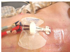
Photo d'un pansement papillon (Statlock).

Lors de la première dialyse qui suit la pose d'un cathéter de dialyse définitif, on appliquera un « pansement papillon ou Statlock » spécial sous le pansement pour accélérer l'insertion du cathéter.