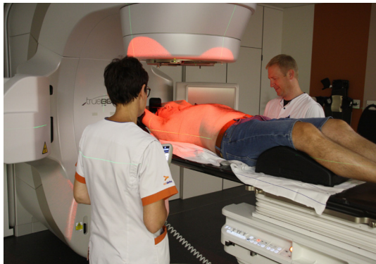
Positionnement sur la table de radiothérapie

Lorsque toutes les données sont correctes, le personnel infirmier quitte la salle d'irradiation. Il peut alors vous observer à l'aide de caméras et vous entendre par un interphone. Si quelque chose se produit pendant votre traitement, par exemple si vous toussiez, la radiothérapie est interrompue et le personnel infirmier revient dans la salle de traitement.