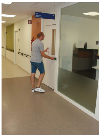
Présentation au secrétariat

Le jour de votre première visite dans notre département de radiothérapie, présentez-vous d'abord au kiosque situé à l'entrée de l'hôpital. Vous serez ensuite redirigé/e vers le secrétariat du service de radiothérapie, où vous signalez à nouveau votre arrivée. La secrétaire vous identifiera par vos nom, prénom et date de naissance. Remettez au secrétariat les étiquettes que vous avez reçues à l'accueil/au kiosque de l'hôpital. Vous pouvez ensuite vous installer dans la salle d'attente. Un de nos médecins viendra vous chercher.