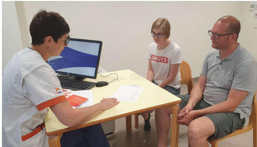
Explication de la simulation par l'infirmier/ère

Vous recevrez également une carte munie d'un code-barres, qui mentionne votre nom, votre date de naissance et votre numéro de dossier. Apportez cette carte tous les jours pendant votre traitement. Elle sera scannée tous les jours lorsque vous entrez. Ce système confirme que vous êtes la bonne personne, pour laquelle le traitement est prêt.