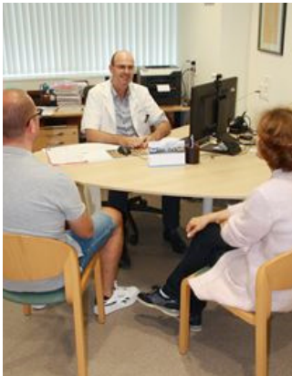
Consultation chez le/la radiothérapeute

Il est important d'informer le/la radiothérapeute des médicaments que vous prenez.