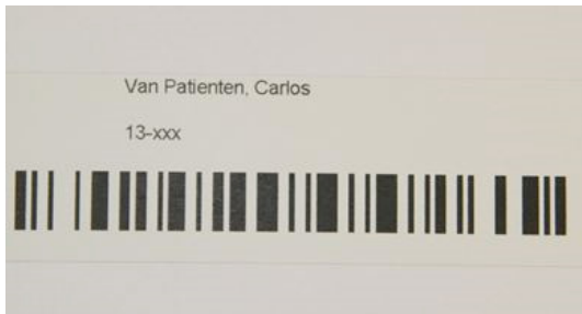
Carte munie d'un code-barres

Vous recevrez également une carte munie d'un code-barres, qui mentionne votre nom, votre date de naissance et votre numéro de dossier. Apportez cette carte tous les jours pendant votre traitement. Elle sera scannée tous les jours lorsque vous entrez. Ce système confirme que vous êtes la bonne personne, pour laquelle le traitement est prêt.