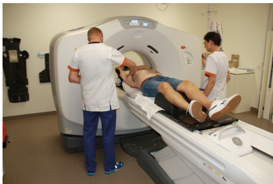
Dessin des lignes

Un(e) infirmier/ère dessine les lignes nécessaires sur la peau. Ensuite, on prend également de simples photos des lignes dessinées.