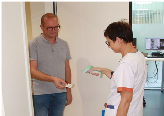
Lecture du code-barres unique

L'infirmier/ère scanne votre carte afin que votre plan de traitement puisse être transmis. Vous voyez votre nom et votre photo apparaître à l'écran de la salle de traitement. Vous pouvez les vérifier lors de chaque séance. Il s'agit d'une sécurité supplémentaire intégrée dans le système.