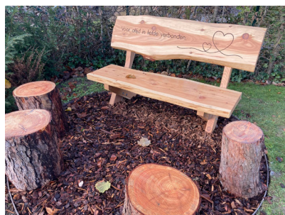
Figure 1: Banc dans le cimetière de Roulers