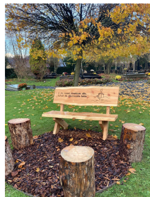
Figuur 3: Koesterplek begraafplaats Roeselare