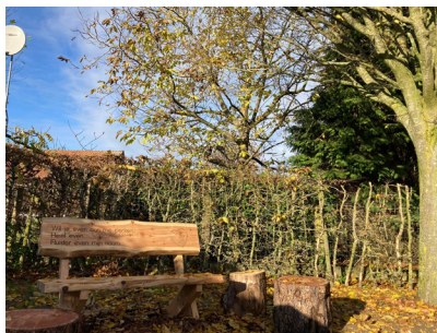
Figuur 4: Bank op de begraafplaats Roeselare "Wil je even aan me denken... Heel even. Fluister even mijn naam."

U kunt op elk moment terecht bij onze psychologe in het ziekenhuis. Zij kan met u verder op weg gaan of zoeken naar de juiste psychologisch begeleiding.