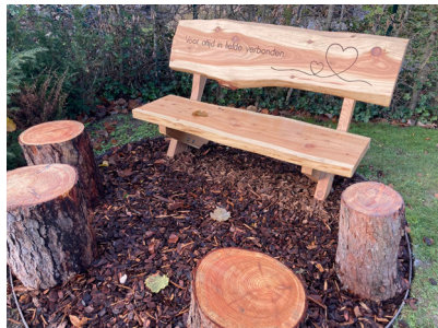
Figuur 1: Bank op de begraafplaats in Roeselare