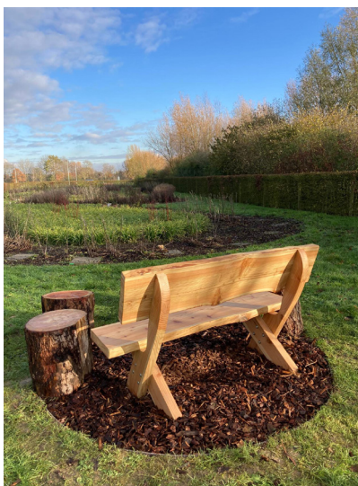
Figuur 5: Bank op de begraafplaats Roeselare

“Onzichtbaar aanwezig. Ver weg. En zo dichtbij”