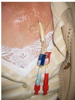
Foto van een katheterverband

controleert of het verband nog intact is en gaat na of er geen tekenen van infectie zijn bij de katheterinsteekplaats. Als het verband intact is en als er geen infecties te zien is, mag het katheterverband tot 6 weken dicht blijven. Als het verband los is of er korstjes te zien zijn, wordt het verband steeds verzorgd. Bij infectie wordt de katheter met een speciaal verband verzorgd dat een ontsmettende werking heeft op de insteekplaats. Eventueel zal er antibiotica opgestart worden.