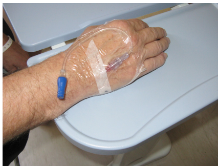
Perifeer infuus met MicroClave®

Dit is een systeem dat enkel mag worden toegepast indien de geplande therapie niet langer dan drie dagen duurt. Na de derde dag wordt de intraveneuze katheter verwijderd door een verpleegkundige of arts op de afdeling.