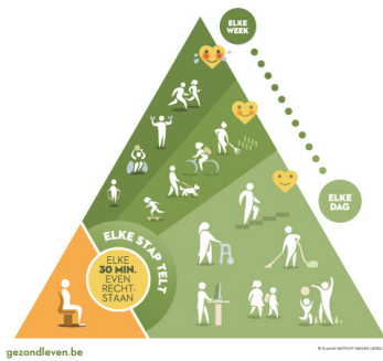
BEWEGINGSDRIEHOEK VERBODEN RECHT STAAWEN GEZOND LEVEN

In deze fase zijn de meeste patiënten goed gerecupereerd. Dagelijkse lichaamsbeweging moet op het programma staan met voldoende aandacht voor een gezond eet- en leefpatroon.