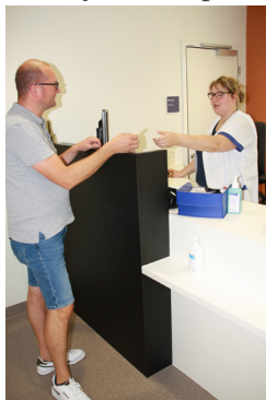
Aanmelden in het secretariaat.