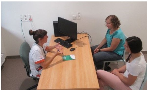
Afspraak met de diëtiste.

Als de aangepaste voeding niet of onvoldoende helpt kan een speciale drinkvoeding of sondevoeding aangewezen zijn.