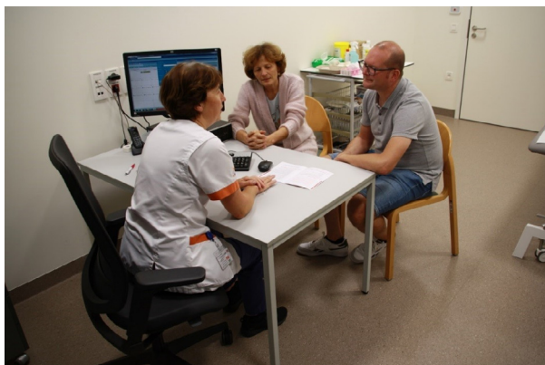
Raadpleging bij de medewerker huidzorg.

Tijdens de behandeling krijg je de mogelijkheid om langs te gaan bij een verpleegkundige gespecialiseerd in huidzorg. Zij zal bovenstaande tips overlopen en nog wat extra advies geven. Meer info in de folder huidzorg.