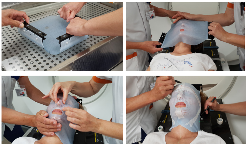
Maken van het masker en het tekenen op het masker.

Voor het maken van een masker lig je op je rug met je hoofd en hals op een speciaal kussentje. De radiotherapeut bepaalt de houding van je hoofd en hals in functie van je bestraling. Het masker wordt eerst in een warm waterbad opgewarmd zodat het zacht en elastisch wordt. Het soepele masker wordt door de medewerkers rond je hoofd en eventueel hals gemodelleerd. Eerst voelt het masker warm en nat maar het koelt snel af naar kamertemperatuur. Er is een opening rond de mond maar ook in het masker zijn er gaatjes zodat je altijd goed kan ademen. Het modelleren van het masker duurt tussen 5 en 15 minuten. Gedurende deze tijd is het belangrijk dat je blijft stilliggen.