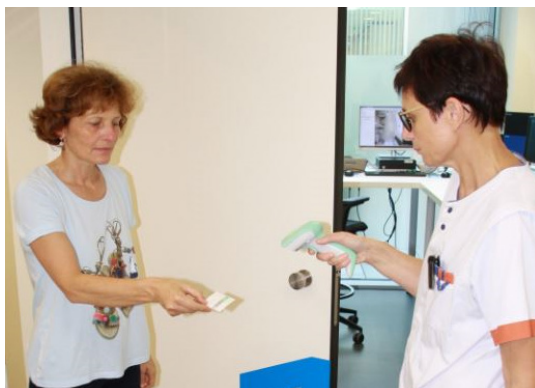
Scannen van de unieke barcode.

Een medewerker scant je kaartje in zodat je behandelplan kan doorgestuurd worden. Je ziet op het scherm in de behandelruimte je naam en foto. Je mag dit dagelijks nazien. Dit is een bijkomende veiligheid die ingebouwd is in het systeem.