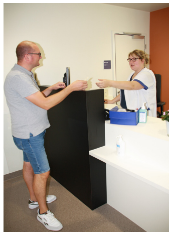
Aanmelden in het secretariaat.