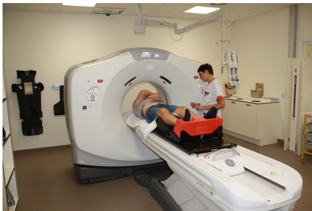
Positionering op de tafel.

Voor de behandeling is het noodzakelijk dat je elke dag op precies dezelfde wijze op de behandeltafel ligt. De medewerkers helpen je bij je positie op de tafel. Deze houding wordt bepaald door de plaats waar je je bestraling krijgt. De medewerkers gebruiken hierbij verschillende hulpmiddelen zoals kussens in een welbepaalde vorm. Het is belangrijk dat je aangeeft of je in die houding comfortabel ligt, zodat je gedurende langere tijd (de tijd nodig voor je bestraling) in die houding kunt stilliggen. Het is erg belangrijk dat je niet beweegt of van houding verandert.