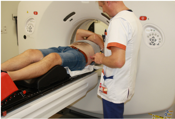
Het aanbrengen van de tatoeagepuntjes.

Meestal is het nodig om enkele punten van de tekening te tatoeëren. Een medewerker op simulatie zal deze punten met een kleine prik in de huid aanbrengen. Dit zijn kleine, blijvende puntjes: tatoeagepuntjes. De medewerker zal je vertellen waar en wanneer deze geprikt worden.