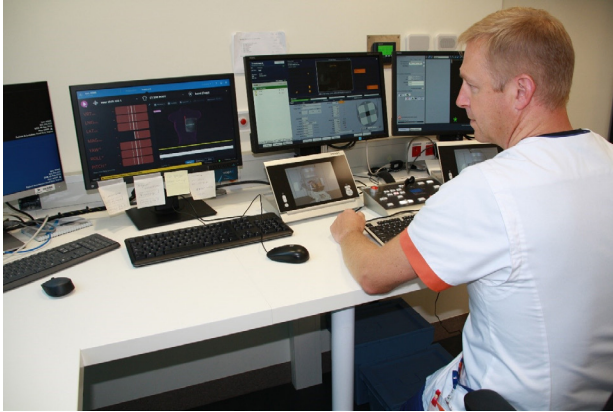
Bedieningsconsole voor het bestralingstoestel.

Tijdens je behandeling blijf je gewoon rustig liggen. Je mag rustig ademen en slikken. Je ziet of voelt de bestraling niet. Je wordt ook niet radioactief door de bestraling. Tijdens de bestraling kan het toestel een scherp zoemend geluid maken.