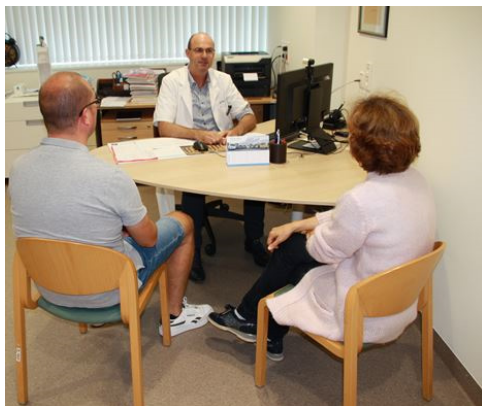
Consultatie bij de radiotherapeut.

De radiotherapeut geeft je uitleg over de eventuele bijwerkingen die kunnen optreden en het te verwachten resultaat van de behandeling.