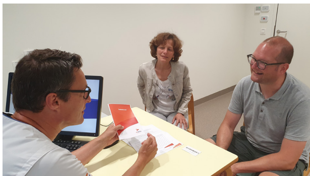
Uitleg door een medewerker van simulatie.

Afhankelijk van het toestel waarop je bestraald wordt kan je ook een kaartje krijgen met je naam, geboortedatum, dossiernummer en een barcode op. Als je een kaartje gekregen hebt, breng je dit dagelijks mee tijdens je behandeling. Dat kaartje wordt dagelijks ingescand wanneer je de bestralingsruimte binnenkomt. Dit systeem bevestigt dat je wel degelijk de correcte persoon bent voor wie de behandeling klaarstaat.