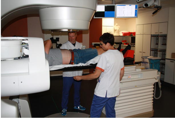
Positionering op de behandeltafel.

Als alle gegevens kloppen, verlaten de medewerkers de bestralingsruimte. Zij kunnen jou dan zien via camera's en horen via een intercom. Als er dan iets gebeurt tijdens je behandeling, bv. je moet hoesten, dan wordt de bestraling onderbroken en komen de medewerkers terug naar binnen in de behandelingsruimte.