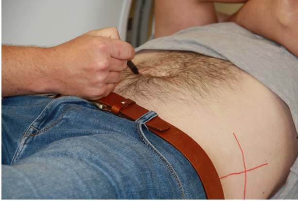
Tekenen van lijnen op de huid.