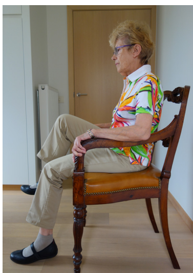
Hef wisselend de knie.