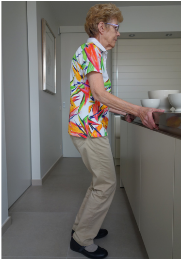
Buig door de knieën.