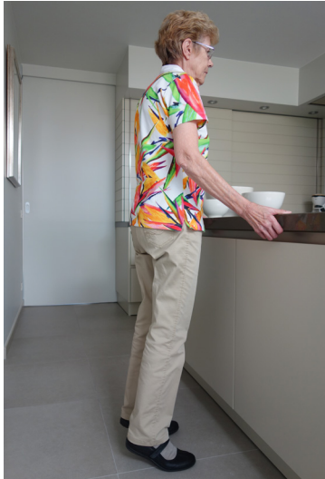
Ga op de tenen staan en tel tot 10.