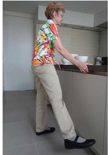
Hef het been zijwaarts op.