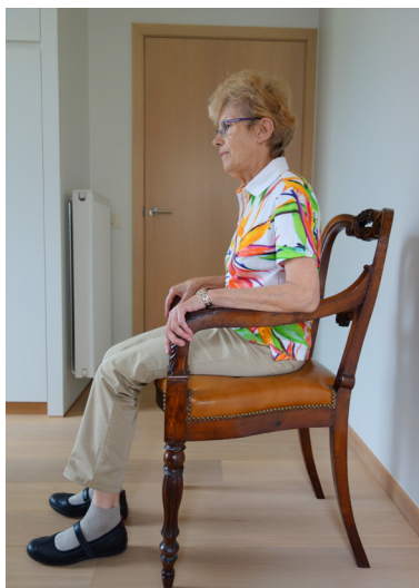
Zit recht zonder te leunen tegen de rugleuning.