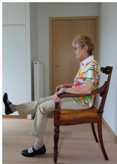
Strek afwisselend rechter- en linkerbeen.