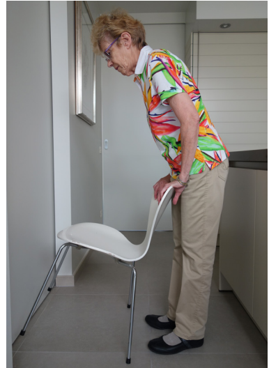
Gebruik nooit een stoel maar altijd een stevige steun zoals een muur of tafel.