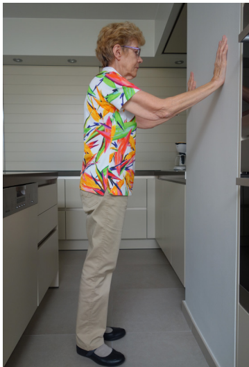
Duw u weg van de muur (= pompen).