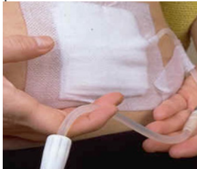
Exemple de pansement de cathéter. (Baxter)

Le pansement d'un cathéter doit être renouvelé trois fois par semaine. Vous pouvez le faire vous-même ou confier cette tâche à votre conjoint ou à votre infirmier/ère à domicile. On vous apprendra comment réaliser correctement les soins de pansement et les signes auxquels faire attention pour détecter précocement une infection.