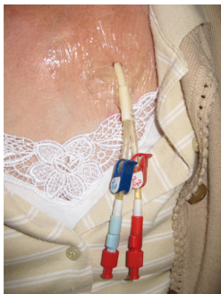
Foto van een katheterverband

verband intact is en als er geen infecties te zien is, mag het katheterverband tot 6 weken dicht blijven. Als het verband los is of er korstjes te zien zijn, wordt het verband steeds verzorgd. Bij infectie wordt de katheter met een speciaal verband aangebracht dat een ontsmettende werking heeft op de insteekplaats. Eventueel zal er antibiotica opgestart worden.