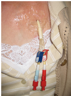
Foto van een katheterverband

controleert of het verband nog intact is en gaat na of er geen tekenen van infectie zijn bij de katheterinsteekplaats. Als het verband intact is en als er geen infecties te zien is, mag het katheterverband tot 6 weken dicht blijven. Als het verband los is of er korstjes te zien zijn, wordt het verband steeds verzorgd. Bij infectie wordt de katheter met een speciaal verband aangebracht dat een ontsmettende werking heeft op de insteekplaats. Eventueel zal er antibiotica opgestart worden.