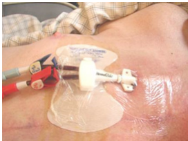
Foto van een vlinderverband (statlock).

De eerste dialyse na plaatsing van een definitieve dialysekatheter, zal er onder het verband een speciaal ‘vlinderverband of statlock’ aangebracht worden om de katheter sneller te laten ingroeien.