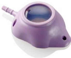
Foto poortkatheter Medcomp

Langs deze katheter kunnen medicatie en infuusvloeistoffen toegediend worden in de bloedbaan. Daarnaast kan een poortkatheter ook gebruikt worden voor bloedafname en het toedienen van contrast bij bepaalde onderzoeken.