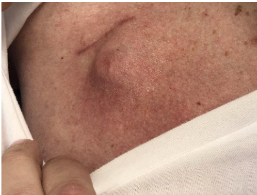
Foto 3 maanden na plaatsing poortkatheter